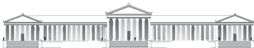
Hauteur du podium restitué à partir de l'ordre type